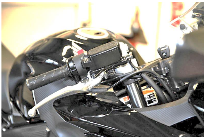
Schéma de pose des câbles et conduites:

Tournez les câbles des gaz vers le bas pour le montage de la poignée d'accélération et effectuez la pose en-dessous du maître cylindre de frein!