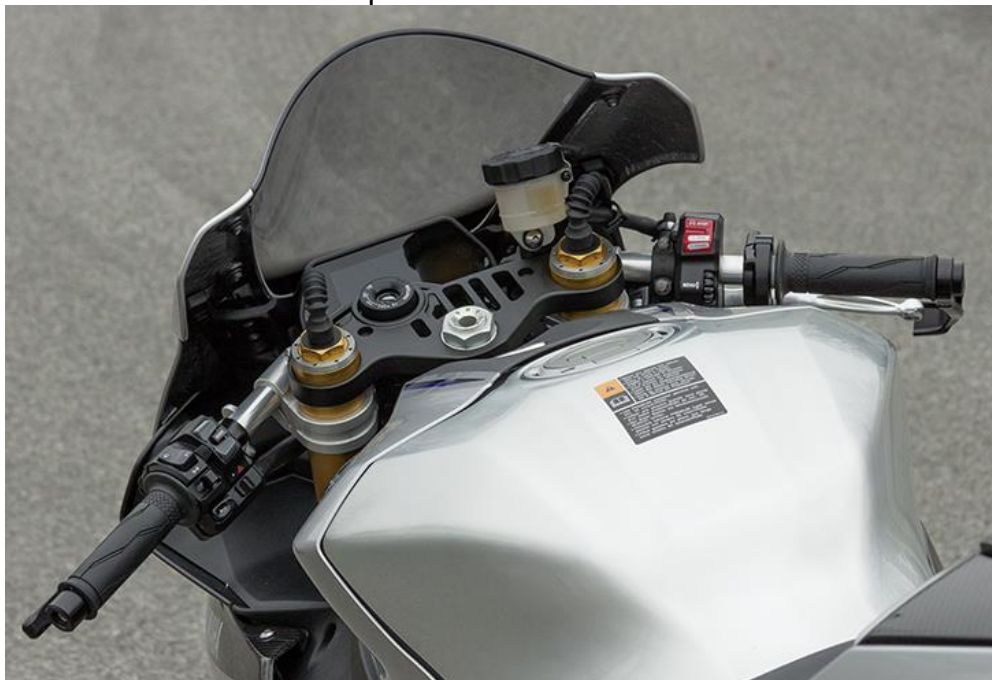
Speed match montiert

Artikel-Nr. : 153Y137R Produkt : Speed-Match Stummellenker Modell : Yamaha YZF-R1 / R1M 2015 → Typ : RN32